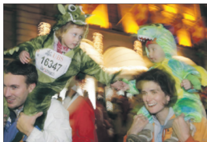
L'Escalade, ce n'est pas seulement l'élite. C'est aussi et surtout une grande fête populaire.