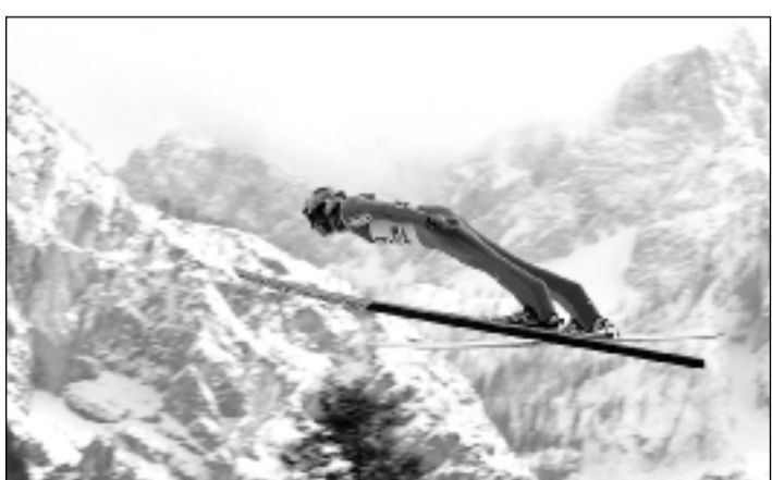
Gregor Schlierenzauer, l'homme oiseau.

• Coupe du monde. Classement final. - 1. Morgenstern 1794. 2. Schlierenzauer 1561. 3. Ahonen 1291. 4. Hilde 1228. 5. Bardal 942. 6. Jacobsen 827. 7. Küttel 778. 8. Happonen 755. 9. Ammann 728. 10. Wolfgang Loitzl (Aut) 715. Puis: 42. Guido Landert (S) 46. Nations: 1. Autriche 6734. 2. Norvège 5302. 3. Finlande 3627. 4. Suisse 1752. 5. Allemagne 1688. 6. Slovénie 1519. 7. Russie 1001. 8. Japon 888. 9. République tchèque 820. 10. Pologne 804. (si)