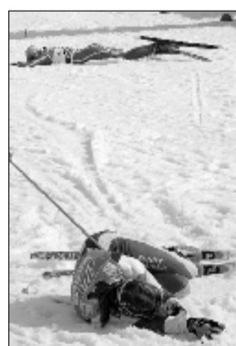
La saison a véritablement été très éprouvante.

• Finales de la Coupe du monde de fond à Bormio. Messieurs. Poursuite (15 km, style libre). - 1. Vincent Vittoz (Fra) 40'19". 2. Lukas Bauer (Tch) à 1'10". 3. Giorgio Di Centa (Ita) à 1'58". Puis les Suisses: 21. Thomas Diezig à 4'52". 29. Curdin Perl à 5'12". 32. Toni Livers à 5'19". 36. Remo Fischer à 5'55". 40. Dario Cologna à 6'35". Coupe du monde. Classement final: 1. Lukas Bauer (Tch) 1462. 2. Rene Sommerfeldt (All) 829. 3. Pietro Pillitteri (Ita)