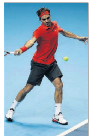
Roger Federer n'a pas tremblé face à Ferrer.

Aujourd'hui. - 15 h: Djokovic - Berdych. 21 h: Nadal - Roddick.